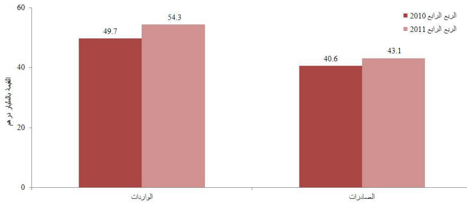
شكل (2) | تجارة المناطق الحرة والمستودعات الجمركية للربع الرابع 2010 - الربع الرابع 2011